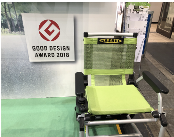
2018年度グッドデザイン賞を受賞した 折りたたみ式電動車いす「ラスレル」

今後もお客様お一人おひとりの「福祉用具を利用することによる目的の達成」のために、お客様の「快適な暮らし」をサポートしてまいります。